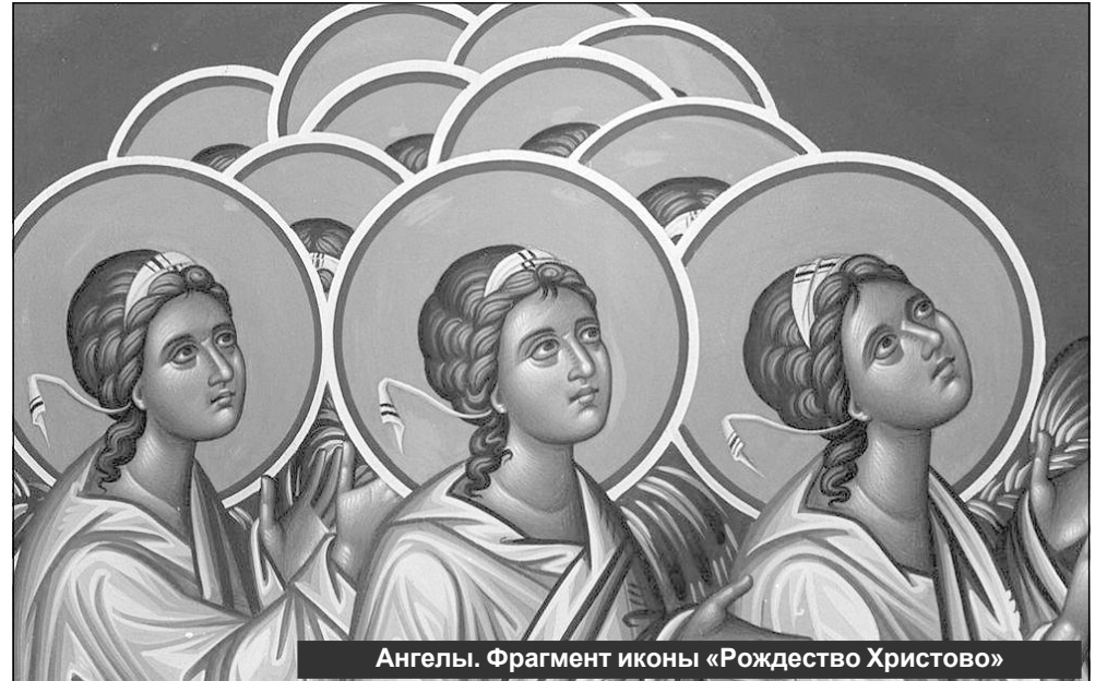
Ангелы. Фрагмент иконы «Рождество Христово»