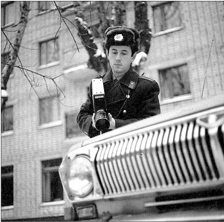
Продолжение. Начало на стр.1

Обычно первой на происшествие выезжает милиция, но вышло так, что я ее опередил. Выйдя из машины, подошел к двери парадного, хотел ее открыть... Вдруг сильный удар по голове, все завертелось перед глазами. Нет, я не упал и сознание не потерял. Подъехали оперативники. Смотрю на них – у одного в руках почему-то горшок с мясистым колючим кактусом. Меня отвели к машине, и тут в парадном шаркнуло так, что дверь вылетела – взрыв.